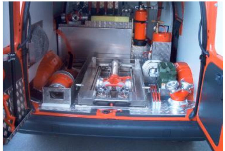
Innenausbau eines Feuerwehrfahrzeugs