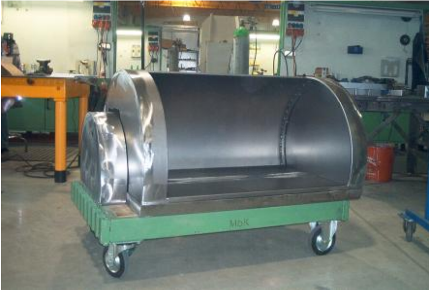
Rundhaube aus Stahl