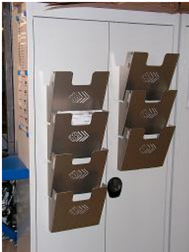
Ablagefächer aus AluNox