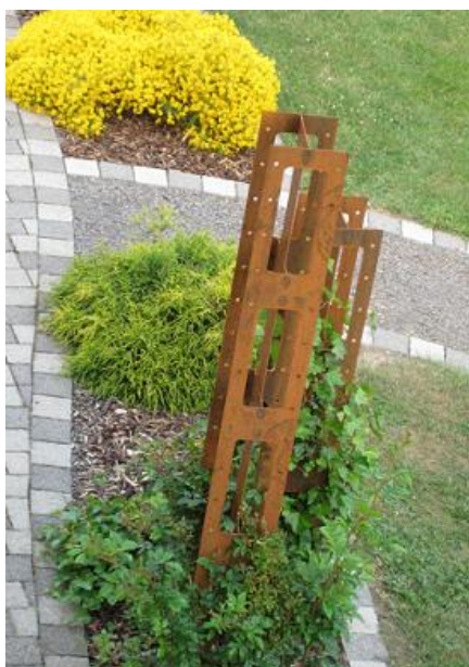
Blumensäule und Hochbeet aus CorTen Stahl