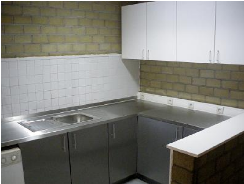
Küchen aus Edlesthahl